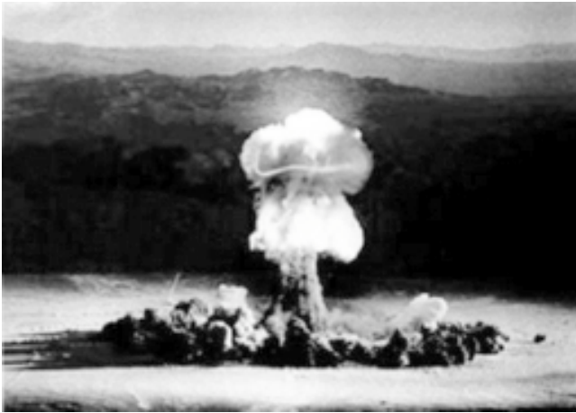
Bildunterschrift Kalter Krieg

benkategorien sind es 87 Artikel, siehe Kasten auf S. ###). Davon fällt ein immenser Anteil (28%) in die sechs Monate des Jahres 1952. Die beiden Jahrgänge 1990 und 1998 sind ebenfalls gut belegt.