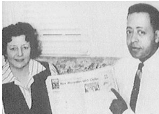
Bildunterschrift B. + B. Hill

In einem weiteren Sinn könnte man auch die den Protagonisten unterstellten Motive unter den Kontext, in den das Berichtete gestellt wird, fassen. Lässt sich ein plausibles „diessseitiges“ Motiv finden und dem Geschehen zuordnen, dann genügt dies der Spiegel -Redaktion offenbar meistens, das Berichtete in einer bekannten Kategorie verorten und damit die kognitive Dissonanz, die